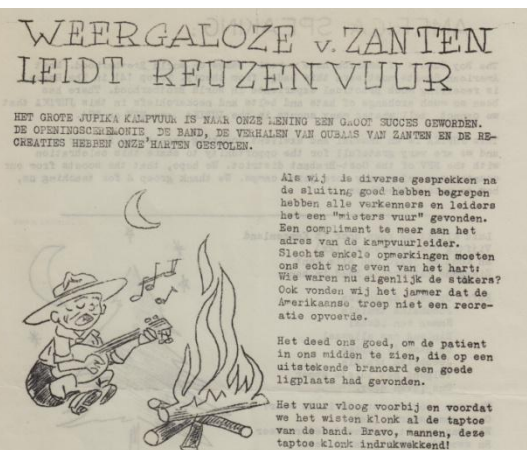
Oûbaas Roel van Zanten vertelt het tijgerverhaal tijdens het Jupika 1962, zondag 10 juni 1962.